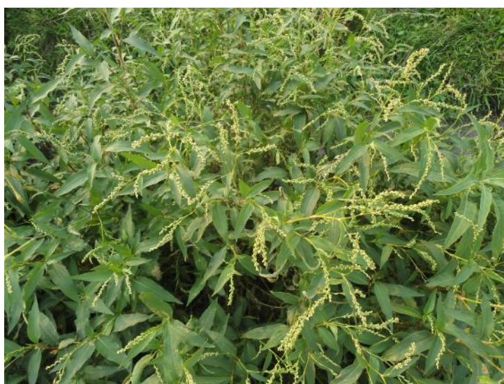
Polygonum punctatum , Elliot, photo by Miguel Martinez, 2012, Martínez et al. pp. 14-27